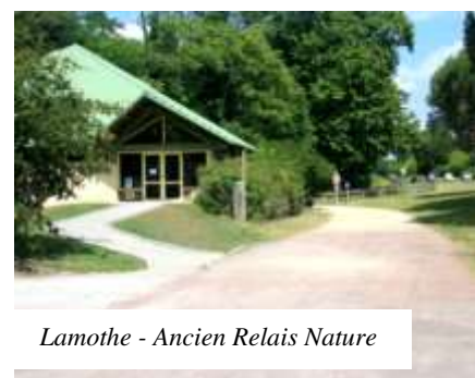
Lamothe - Ancien Relais Nature